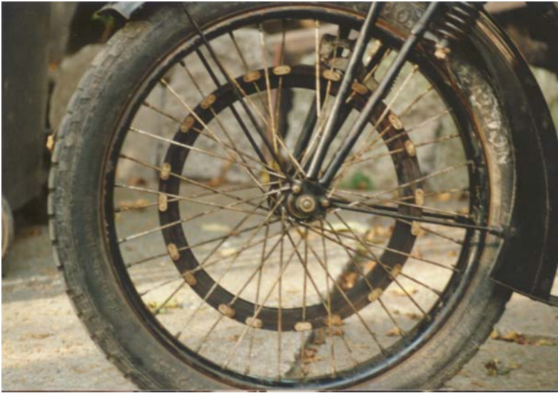
Bild 5 Vorderrad K III

Ein Geduldspiel war das Montieren der Bremsfelgen: mit kleinen Blechen und je zwei Schrauben M 3,5 (!) mussten vorne und hinten zwei Bremsfelgen zentriert werden (diese Geduldsaufgaben erledigt zum Glück meine Frau). Auf diese Felge wirkt hinten per Fußbremse und vorne per Seilzug umgelenkt, einfach ein Klotz. Dieser bewirkt eine „gewisse Verzögerung“ – Bremsen wäre zu viel gesagt.